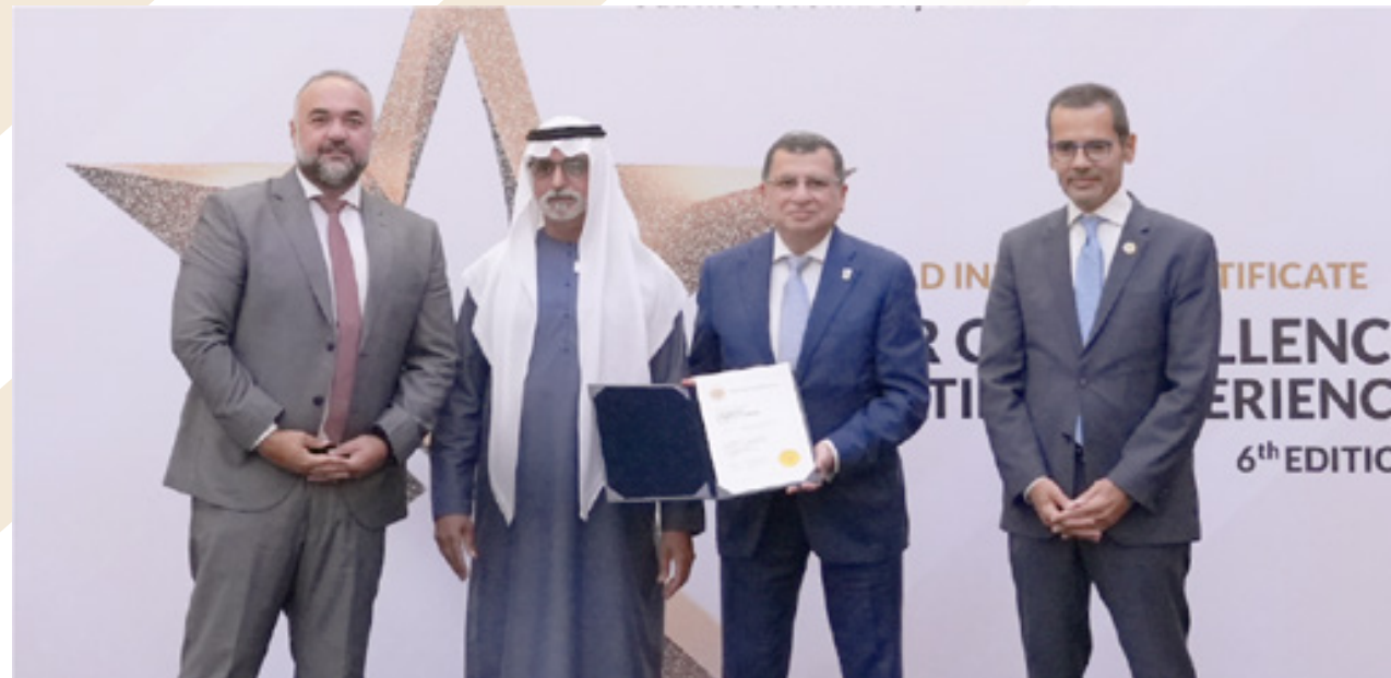
Cleopatra Hospitals Group