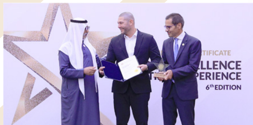
Abu Dhabi Health Data Services