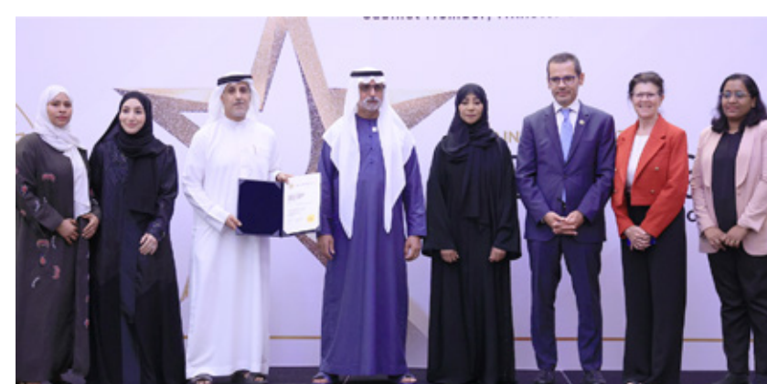
Sheikh Tahnoon Bin Mohammed Medical City