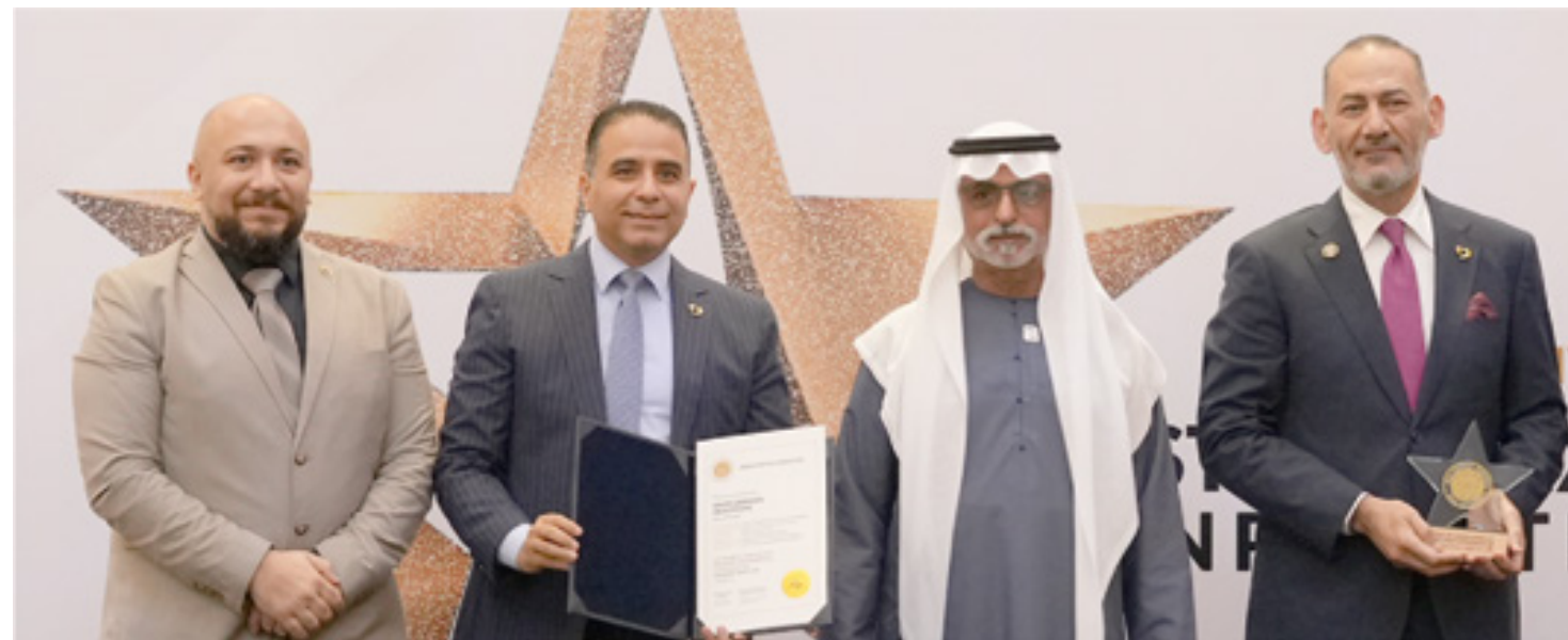
Saudi German Health UAE