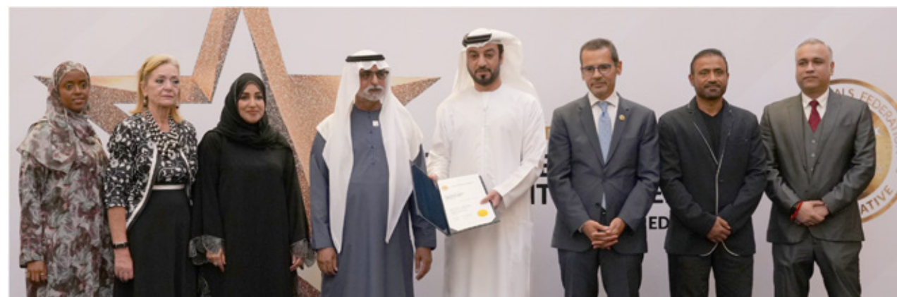
Sheikh Khalifa Medical City