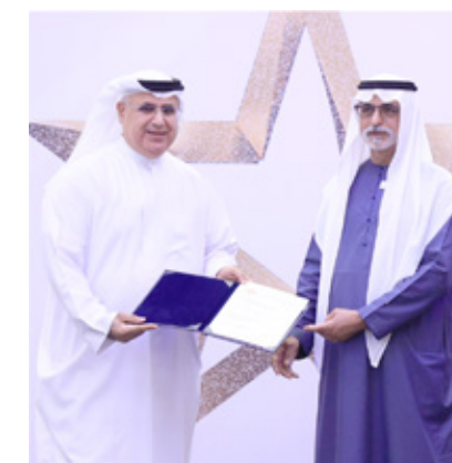
Al Qassimi Hospital