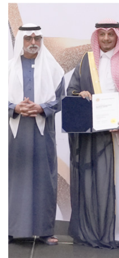
AlTakassusi Alliance Medical Limited