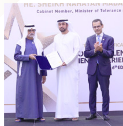
Al Dhafra Hospitals