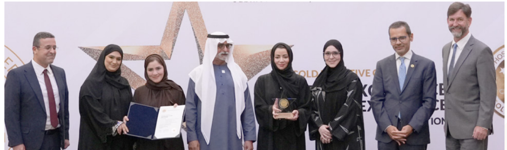
Cleveland Clinic Abu Dhabi