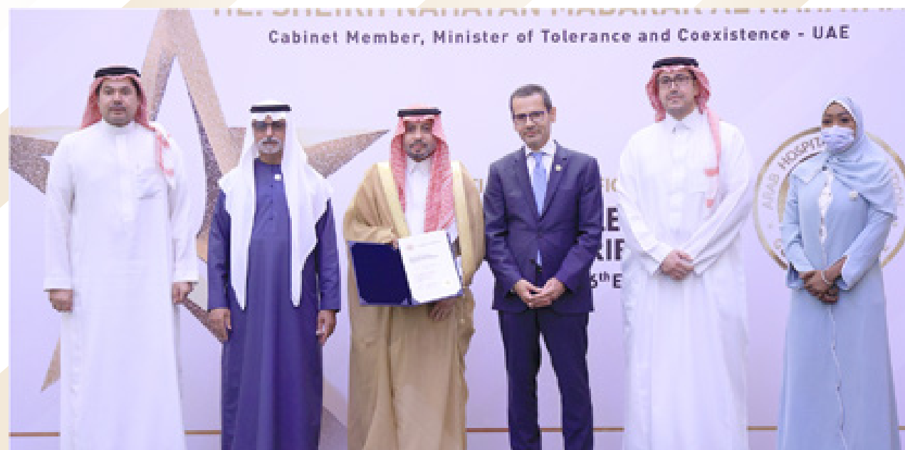
Security Forces Hospital - Dammam