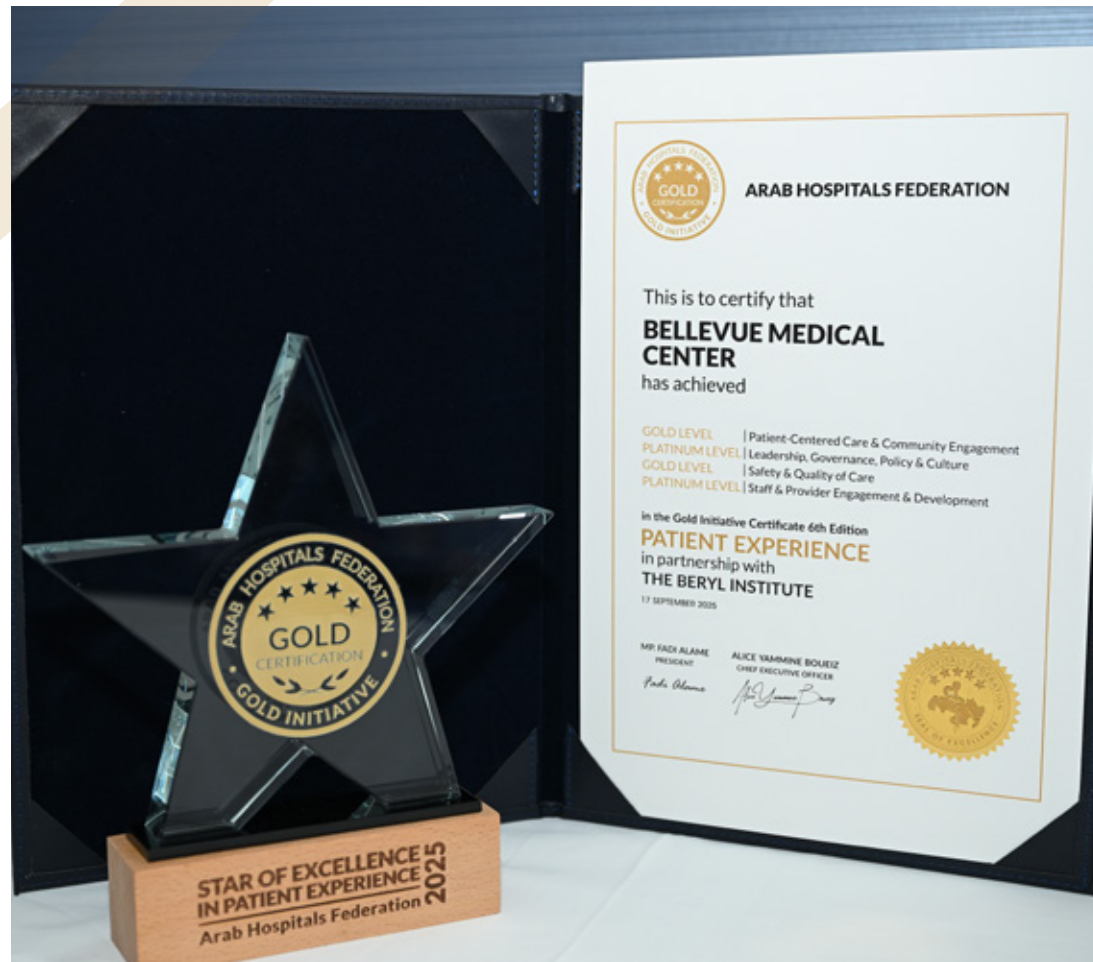
Bellevue Medical Center