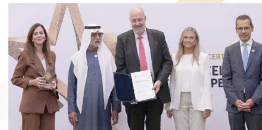
American University of Beirut Medical Center