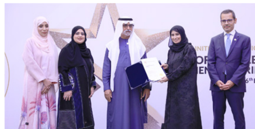
Al Kuwait Hospital Dubai