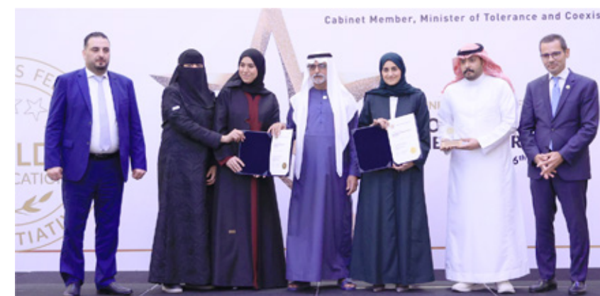
Al Moosa Rehabilitation Hospital & Al Moosa Specialist Hospital