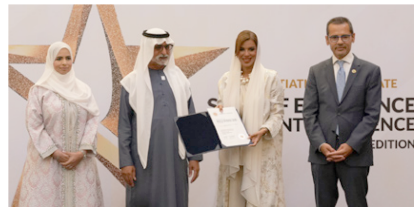
Quality Assurance Center- MOH Oman