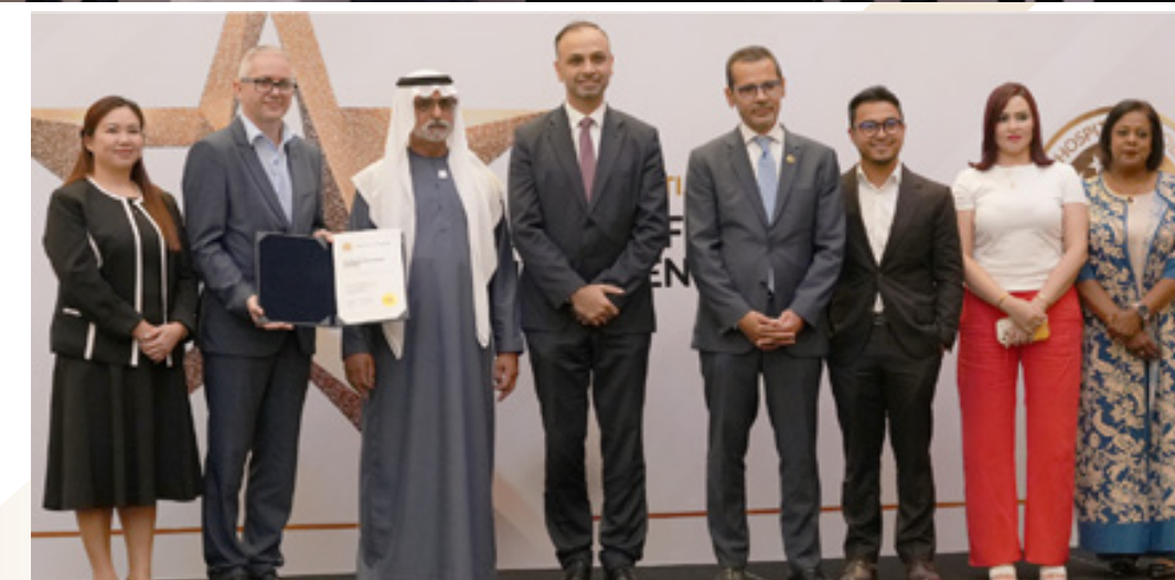
Salma Rehabilitation Hospital