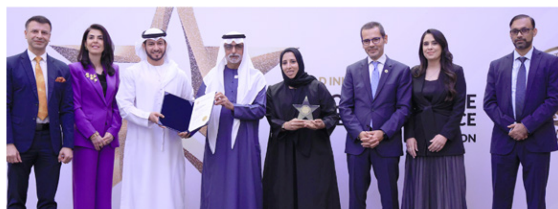
Sheikh Shakhbout Medical City