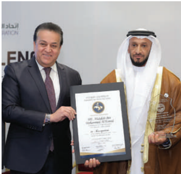
HE. ABDULLAH BIN MOHAMMED AL HAMED CHAIRMAN OF DEPARTMENT OF HEALTH – ABU DHABI