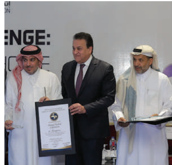
HAMAD MEDICAL CORPORATION

DISTINGUISHED AWARD FOR HEALTHCARE IMPROVEMENT