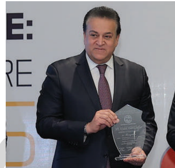
HE.DR KHALED ABDEL GHAFAR MINISTER OF HEALTH EGYPT

DISTINGUISHED AWARD FOR HEALTHCARE IMPROVEMENT