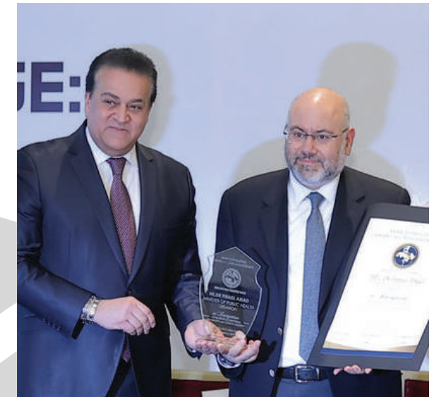
HE.DR FIRASS ABIAD MINISTER OF PUBLIC HEALTH LEBANON

ARAB DISTINGUISHED AWARD IN CRISIS MANAGEMENT