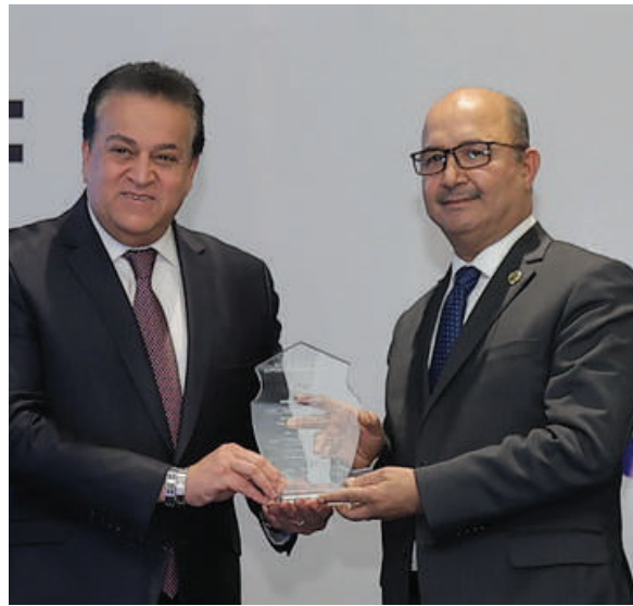
HE. AHMAD ABUL GHEIT GENERAL SECRETARY LEAGUE OF ARAB STATES

DISTINGUISHED AWARD FOR SUPPORTING HEALTH