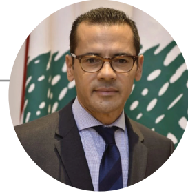
النائب فادي علامة الرئيس