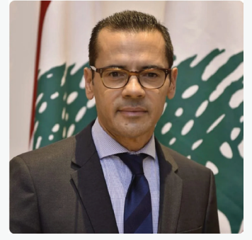
النائب فادي علامة الرئيس